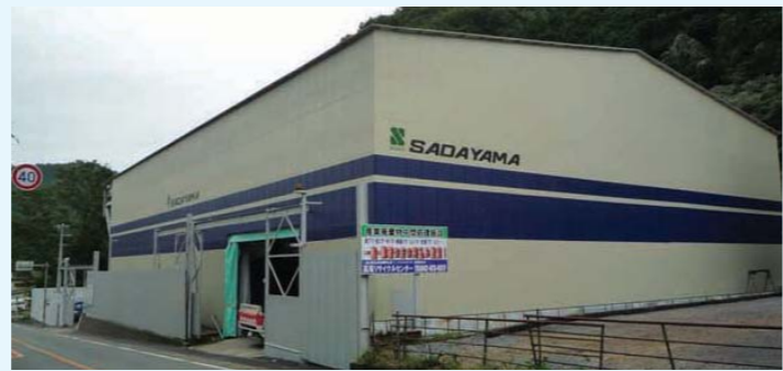
高尾リサイクルセンター

2009年設立。選別・資源化ラインをはじめ、紙くず、木くず、繊維くずなどの破砕機、廃プラスチック・硬質プラスチックなどの圧縮機、廃発泡スチロールを溶解し、インゴット化する発泡スチロール減溶機を完備。見学に来て頂いた方もわかりやすい、クリーンで、一連の処理の流れが見える施設が特徴です。